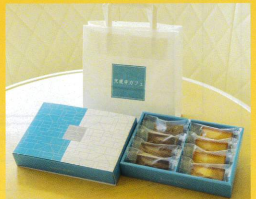
No.6 天現寺カフェオリジナル フィナンシェ2種 (各4個入)

天現寺カフェがプロデュースする新・東京お土産スイーツ リッチな味わいの「ロイヤルミルクティ&ハニーフィナンシェ (個包装)」2種を詰め込みました ※賞味期限：製造日から90日間 ※配送：常温