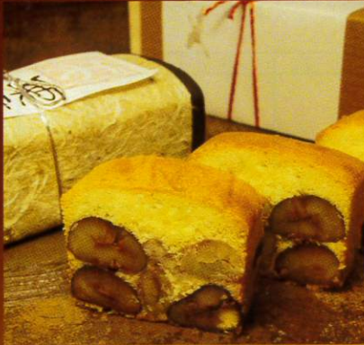
No.1 足立音衛門 栗のテリーヌ「天」(プレーン)

※熨斗・ご配送承ります／ご予算ご用途に応じて焼菓子の詰め合わせもいたしております