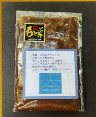
No.4 天現寺カフェオリジナル もとぶ牛の贅沢ご褒美ハヤシライス

丹精込めて和牛すじ肉とたっぷり玉葱をじっくり煮込んで仕上げました。 脂にはクセがなく、かつ甘みのある味わいが特徴です 老舗のカフェ飯をご自宅でもお楽しみください ※賞味期限：製造日から1年間 ※配送：冷凍