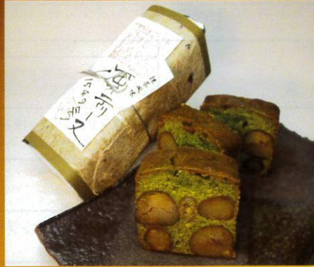
No.2 足立音衛門 栗のテリーヌ「天」(抹茶)

栗のテリーヌ「天」(プレーン)の生地香り豊かな宇治抹茶を加え、天現寺カフェの為に特別に焼き上げた限定フレーバーです ※賞味期限：2週間 ※配送：冷蔵 ※専用木箱（1本用/2本用）別途各550円 ※プレーンと抹茶を1つの木箱に収めることも可能です